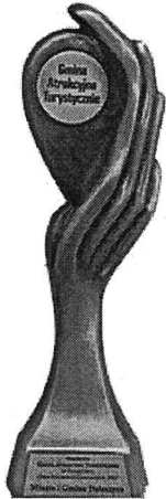
Gmina Atrakcyjna Turystycznie w Plebiscywie „Orły Polskiego Samorządu 2017”