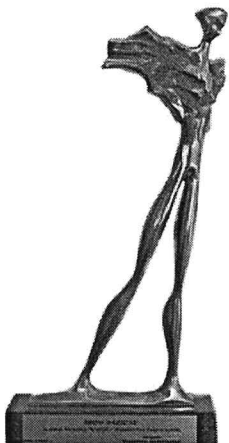
Nagroda „Wędrowiec Świętokrzyski” za zasługi dla rozwoju turystyki w Województwie Świętokrzyskim